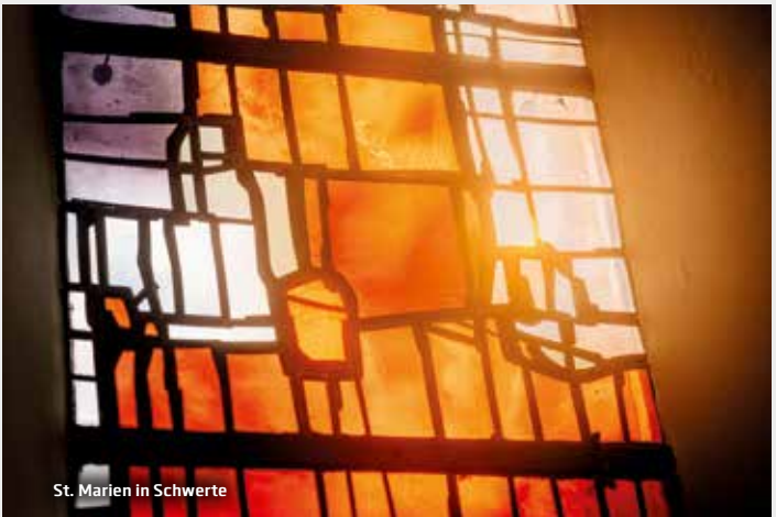
St. Marien in Schwerte