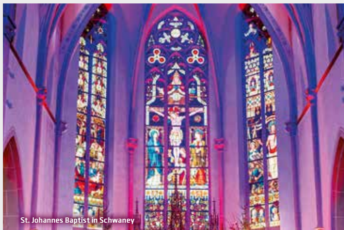
St. Johannes Baptist in Schwaney