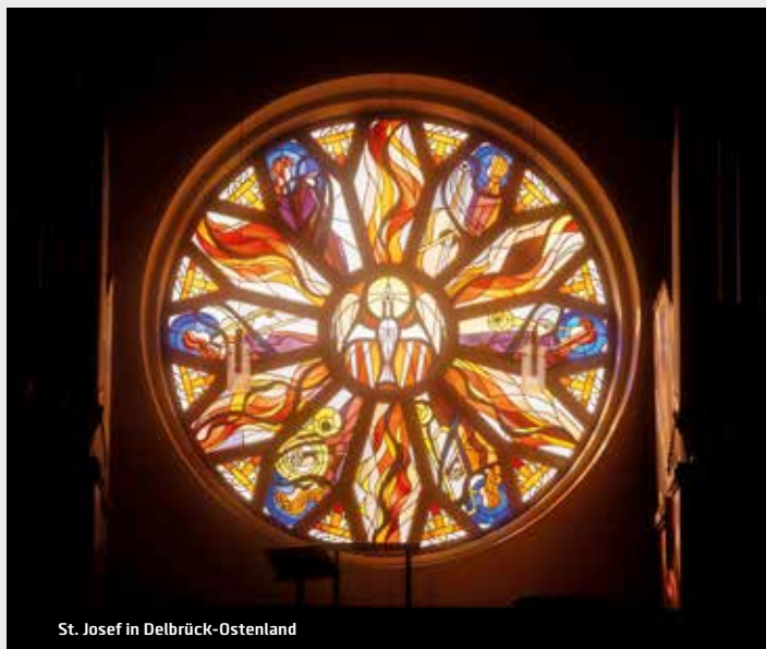
St. Josef in Delbrück-Ostenland