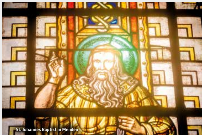
St. Johannes Baptist in Menden