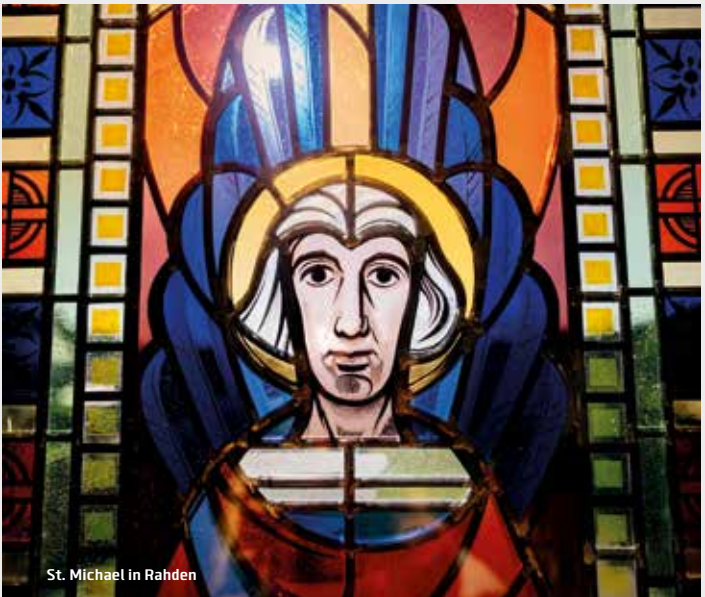
St. Michael in Rahden