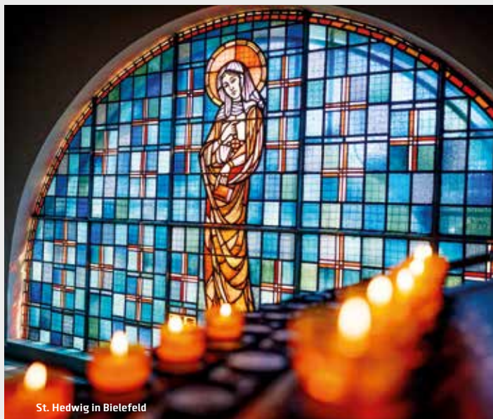
St. Hedwig in Bielefeld