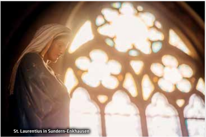
St. Laurentius in Sundern-Enkhausen