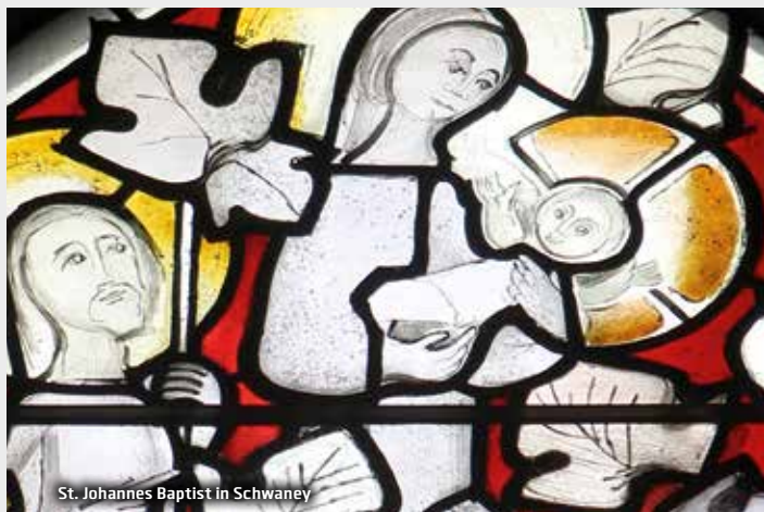
St. Johannes Baptist in Schwaney